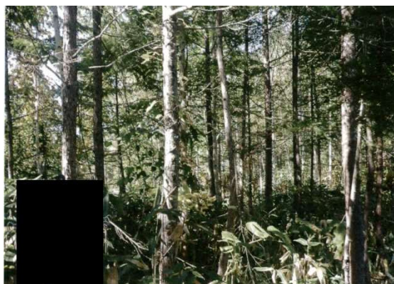
保育間伐実施前の森林