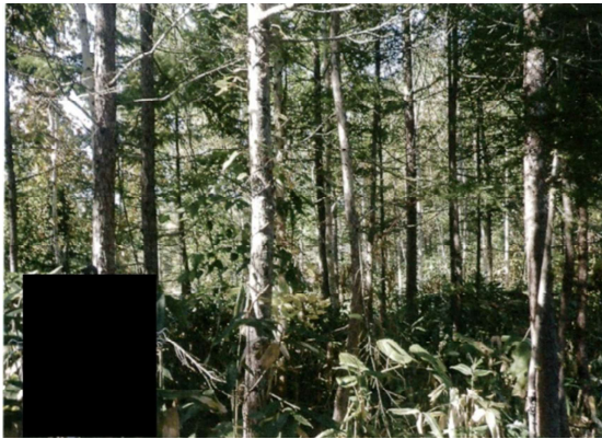
保育間伐実施前の森林