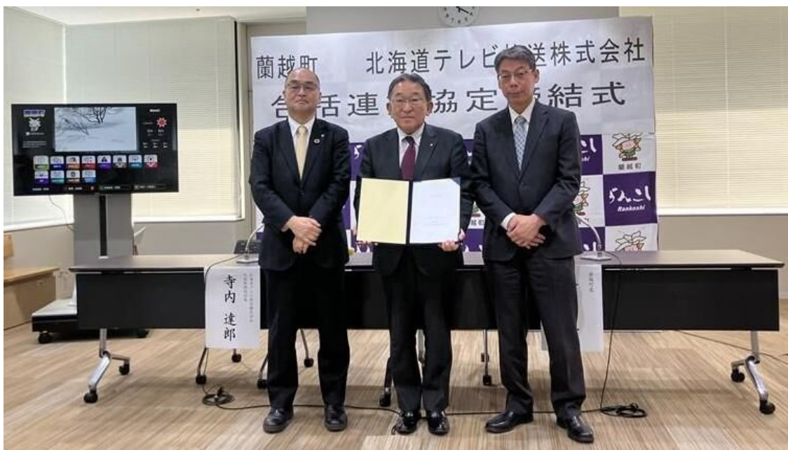
(左から HTB 寺内代表取締役社長、蘭越町 金町長、JCC 大熊代表取締役 COO)

今後も北海道テレビ放送様と連携し、町民の皆様が安心して暮らせるまちづくりをサポートしてまいります。