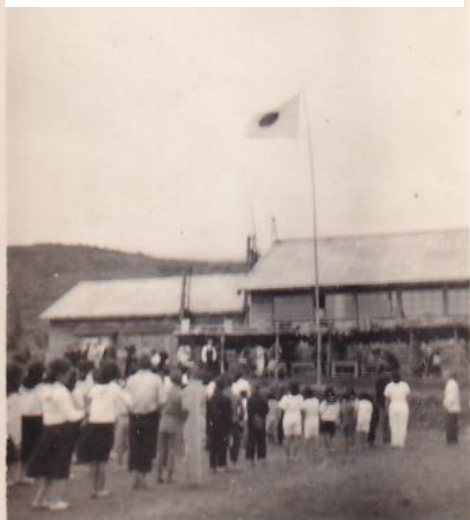
第1回運動会（昭和26年）

グラウンドは、笹藪を開いた石だらけの場所でチョロチヨロと小川も流れていて、かろうじて子どもたちが鬼ごっこできるくらいの広さしかありませんでした。赴任したその年に校長先生の提案で運動会をしようということになって、グラウンドが広げられました。子どもがいるいないにかかわらず、一家から一人手伝いに来てくれました。クワやスコップやつるはしや一輪車を持ち寄って、人力で動かさない大きい石は鎖をかけて馬で引いて動かしていました。10日くらいかかったと思います。グラウンドが完成した後に行った運動会は地域の一大イベントで大盛況した。