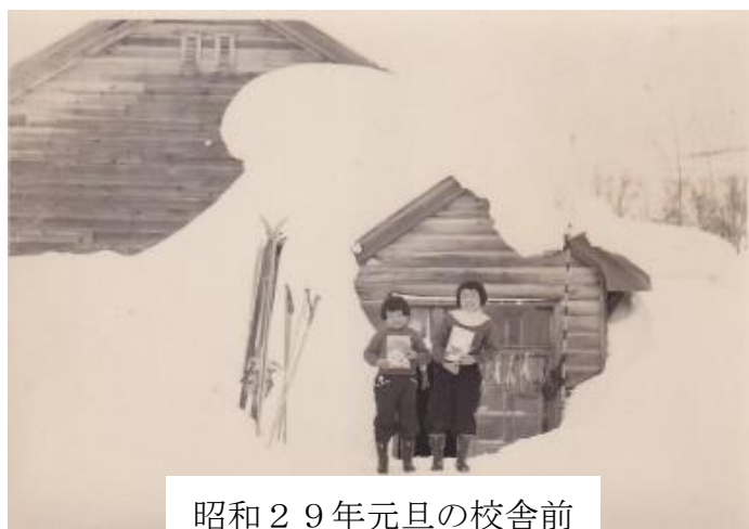
昭和29年元旦の校舎前

それから、どこかの使われなくなった集乳所をもってきたという建物が学校の傍に建てたのですが、それを改築してて集会室や宿泊室だけでなくパン焼窯やかまどのついた台所のある公民館ができました。この公民館の台所を使って婦人会が給食を始めました。