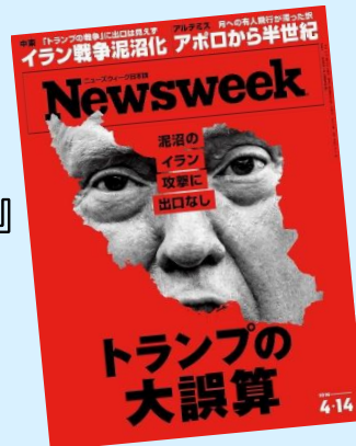
『Newsweek 日本版 2026 年 4 月 14 日号』 (CE メディアハウス)