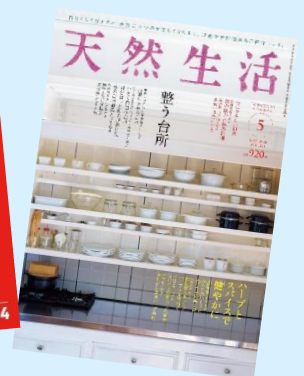
『天然生活 2026 年 5 月号』 (扶桑社)