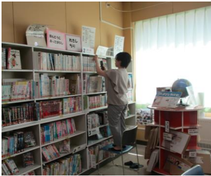
昆布小学校図書館蔵書点検