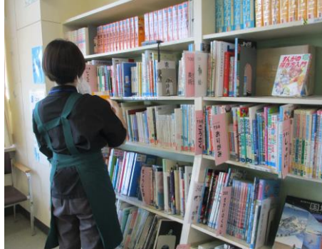
蘭越小学校図書館蔵書点検